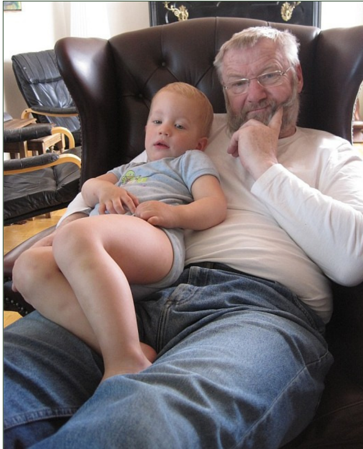
Farfar er Keddes "allerbedsteste goe ven!"