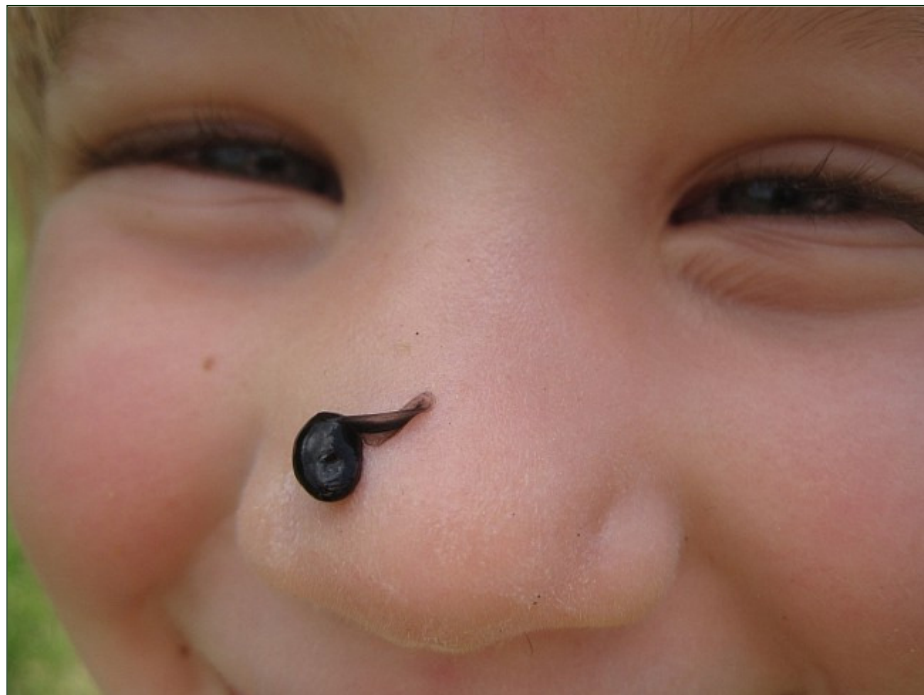
Her har hun taget en haletudse på næsen ;-)