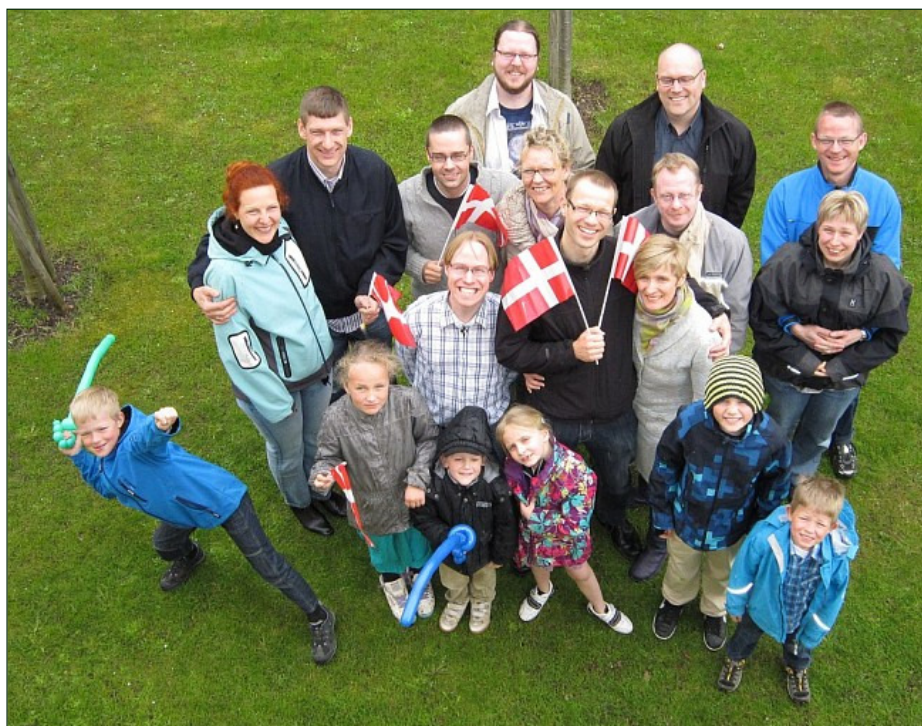
Jeg blev meget rørt. Det var fantastisk at blive varmet af sådan en kærlig handling - tak! :)