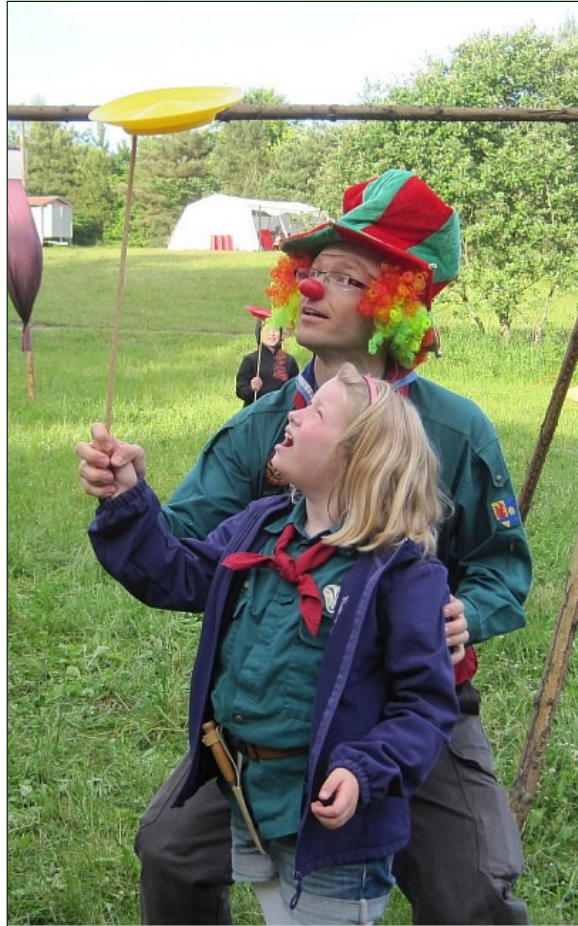
Det var gøglertema, så det passede mig jo ret godt :).