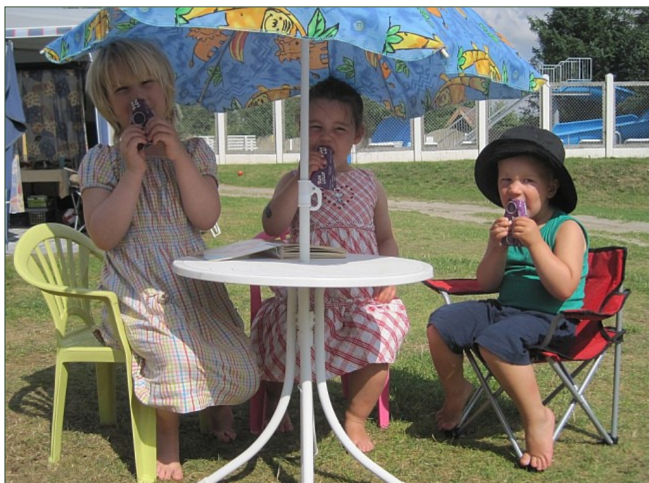
I sommers arrangerede farmor en dejlig uge på Askhøj Camping i Silkeborg.