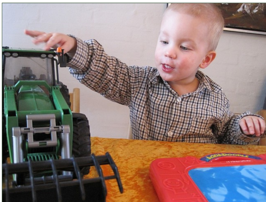
Keddes favoritlegetøj er ting med motor. Traktorer, tog og biler kan han få timer til at gå med.