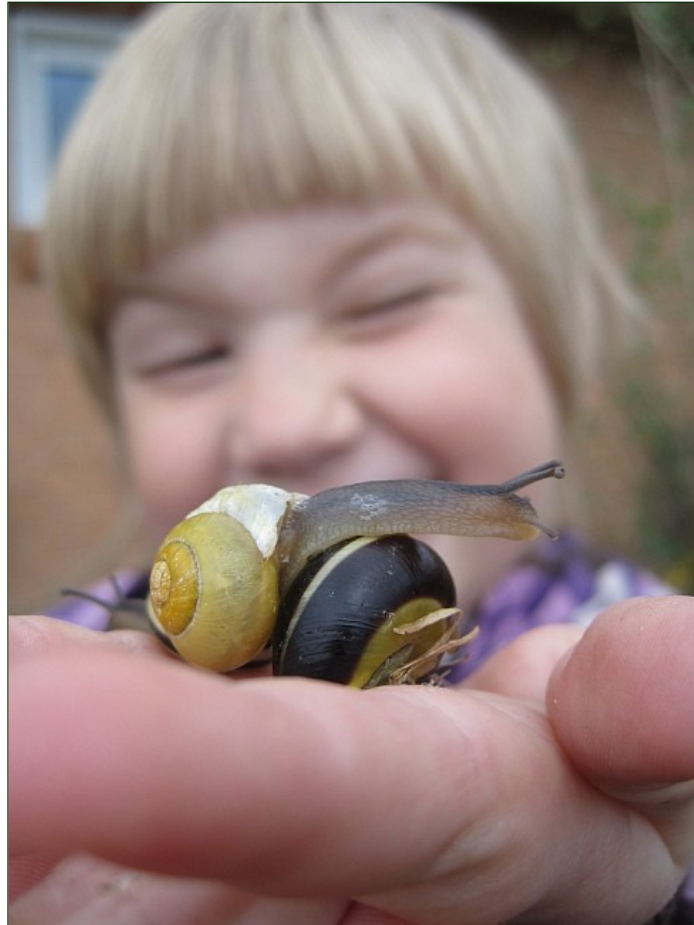
Laura er stadig rigtig glad for alle slags små dyr.