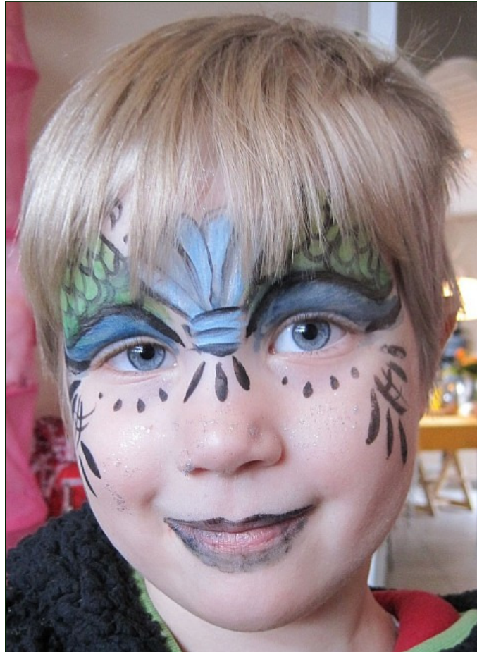
Her er hun blevet sminket som havfrue på en tur til Randers Regnskov.