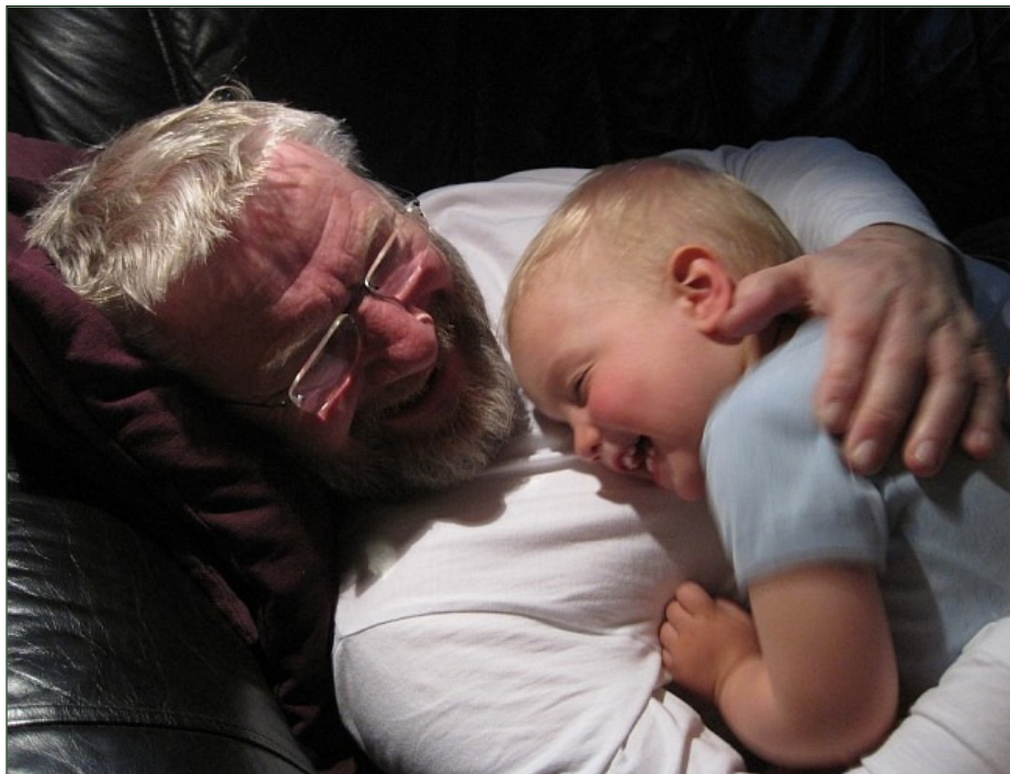
Det er dejligt at se de to hygge sig sammen.