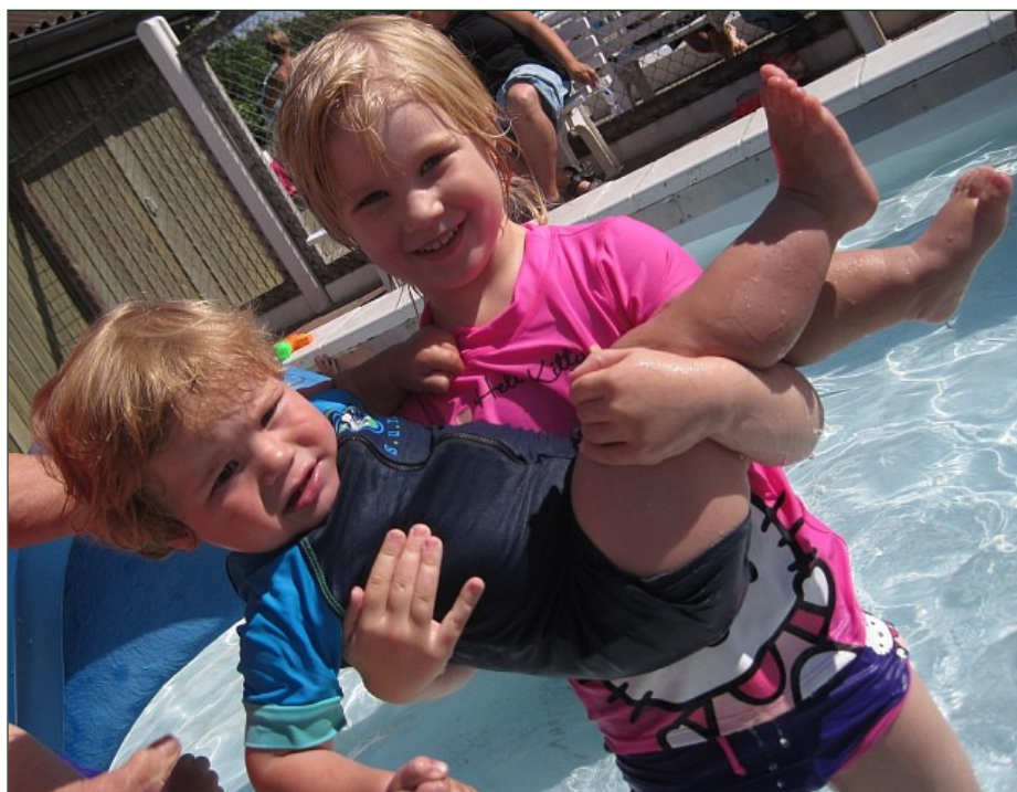
Der blev hygget, badet, leget og spillet hele ugen - superhyggeligt! :)